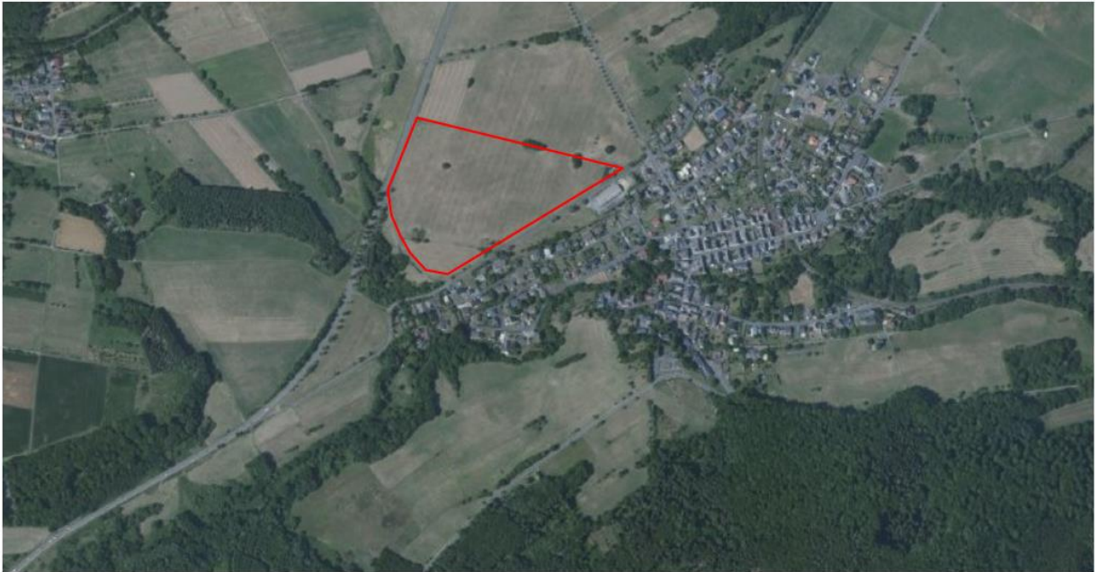
Abbildung 1: Luftbild des Plangebiets nordwestlich von Willmenrod